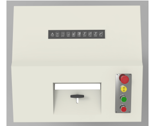
图 4：粉碎 SSD 硬盘